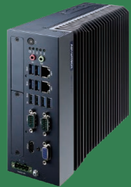
Water A2O Private server